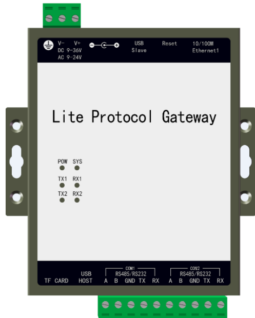
图片一 壁挂式安装