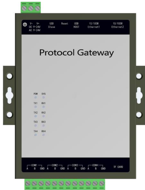
图片一 壁挂式安装