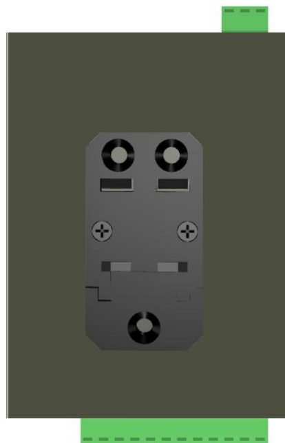
图片二 导轨式安装