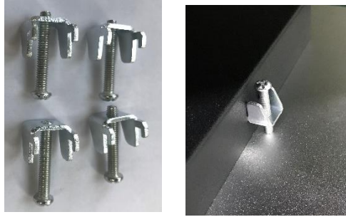
图四 嵌入式卡扣安装 如图所示